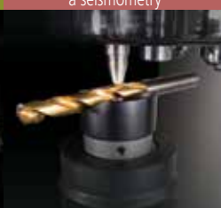
Zkušební přístroje a seismometry