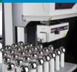
Přístroje na měření tvaru