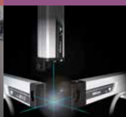
Digitální pravítka a DRO systémy